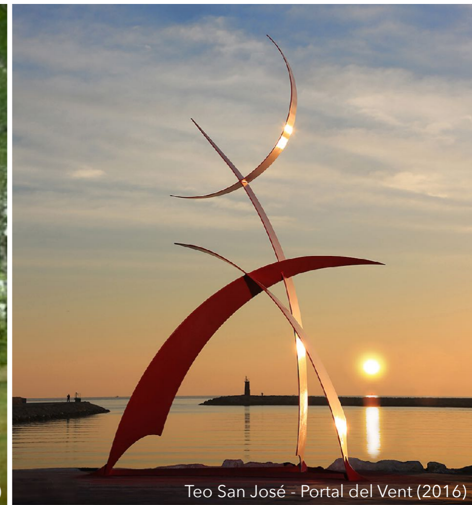
Teo San José - Portal del Vent (2016)