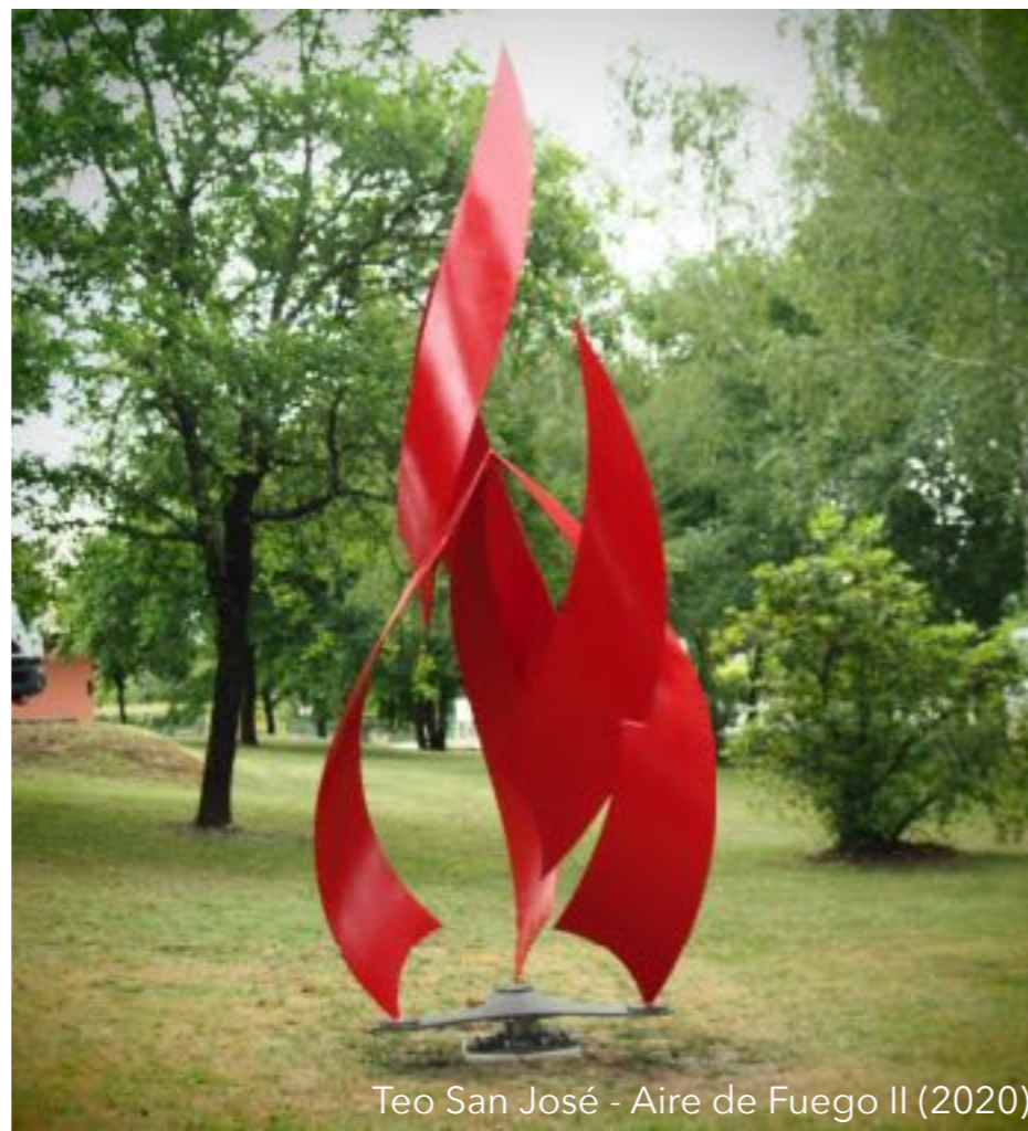
Teo San José - Aire de Fuego II (2020)