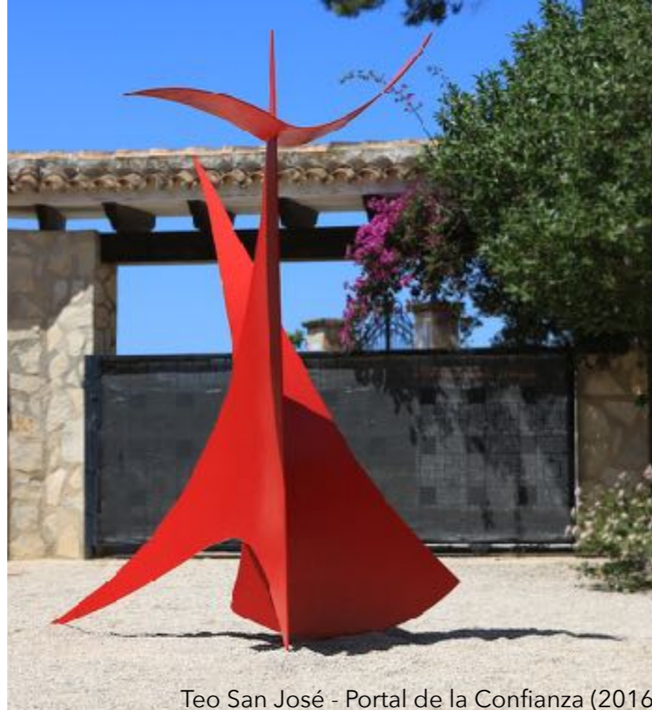
Teo San José - Portal de la Confianza (2016)