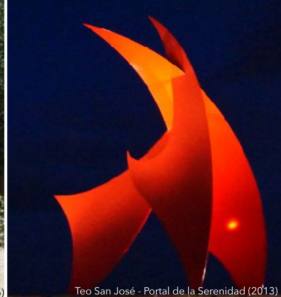
Teo San José - Portal de la Serenidad (2013)